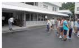
・出発時にご挨拶を頂きました。