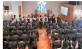
・感謝のお言葉を頂き、職員が仕事のやりがいを感じる瞬間です。