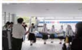
・合唱部：ご到着のご挨拶。