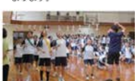
・パン食い競争で大盛りです。