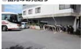
・感謝の気持ちを胸に職員でお見送ります。 (来年も宜しくお願いします!!)