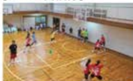
・バスケ部/バレー部：毎年のご利用に感謝です。