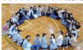
・これからレクリエーションが始まります。