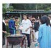
・BBQで気分転換です。