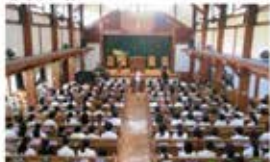
・職員に、始まりの緊張感が漲ります。