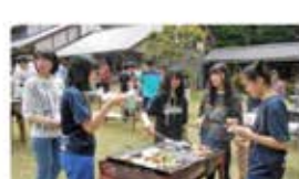
・皆で味わうバーベキューは格別です。