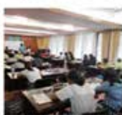
・集中講義が始まりました。