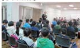
・開校式で山荘からご挨拶。