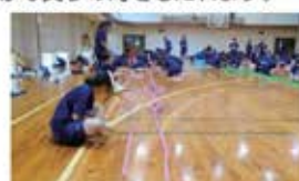
・恒例のドミノゲームです。