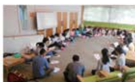
・宗教合宿：今年で5年目を迎えました。